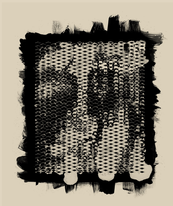
Mesh Cover 6/8 | Festival Design of the Monheim Triennale © Vasilis Marmatakis

16 Künstlerinnen und Künstler sind eingeladen, eigene Projekte zu entwickeln, mit denen sie vom 30. Juni bis zum 4. Juli in unterschiedlichen Konstellationen mehrfach zu erleben sein werden.