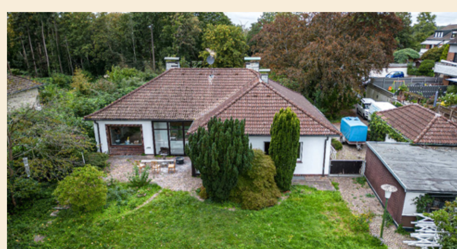
The new residence of the Monheim Triennale : Villa am Greisbachsee