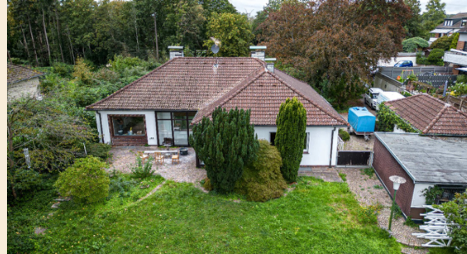
Die neue Residenz der Monheim Triennale : Villa am Greisbachsee