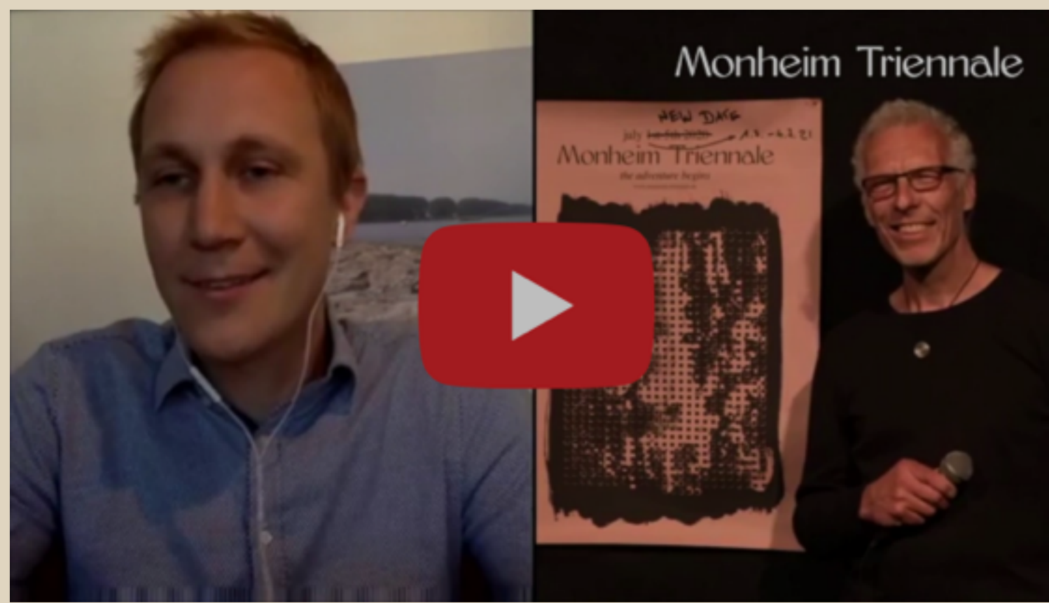
Missed the live stream? Click on the picture to watch it again.