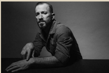
Colin Stetson

Zur Eröffnung von „ The Prequel “, der Sonderausgabe der Monheim Triennale, werden am 1. Juli 2021 um 19 Uhr mit einer Folge von Duos verschiedener Künstlerinnen und Künstler dem epochalen Meisterwerk „ Escalator Over The Hill “ von Carla Bley ihre Referenz erweisen. Es folgen vom 1. bis 3. Juli zahlreiche weitere international besetzte Konzerte in Monheim am Rhein . Aufgrund der niedrigen Inzidenzzahlen können wir alle Konzerte kurzfristig vor einem begrenzten Publikum stattfinden.