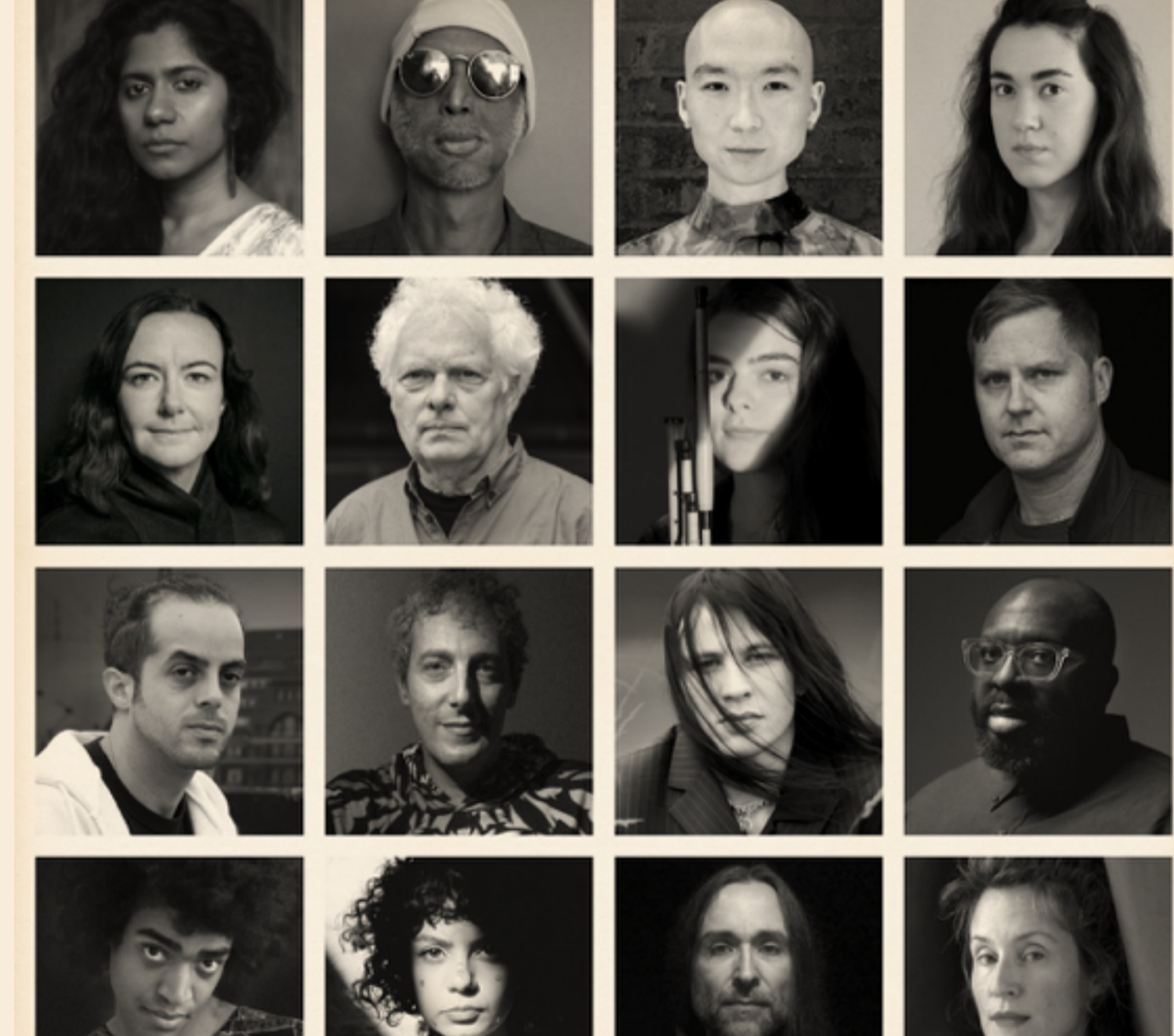
The new generation of signature artists of the Monheim Triennale II