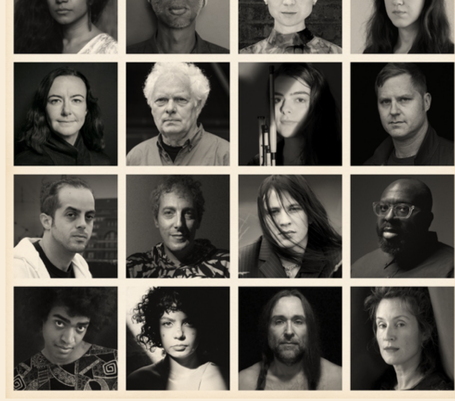
Die neue Generation der Signature Artists der Monheim Triennale II